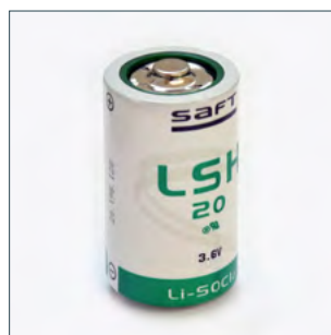
SAFT batterie au lithium Numéro de commande 820007318