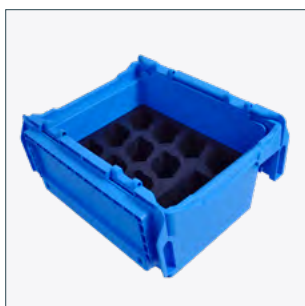
Boîte de transport avec espace pour 10 enregistreurs SmartEAR et avec compartiment supplémentaire Numéro de commande 2014649