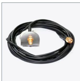
Rallonge d'antenne (3m) Numéro de commande 2011249