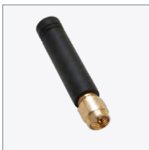
Antenne tige Numéro de commande 90035958