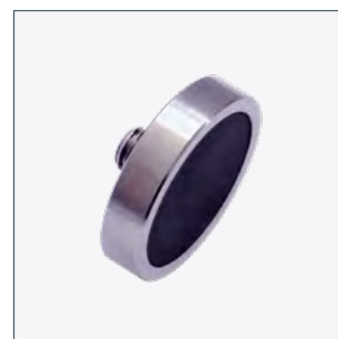
Adaptateur magnétique (automatiquement inclus avec chaque enregistreur SmartEAR) Numéro de commande 820015167