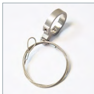
Anneau magnétique avec antivol câble en acier inoxydable Numéro de commande 2015049