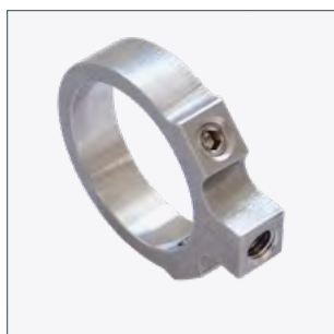
Anneau magnétique (réglable librement à 360°) Numéro de commande 2015069